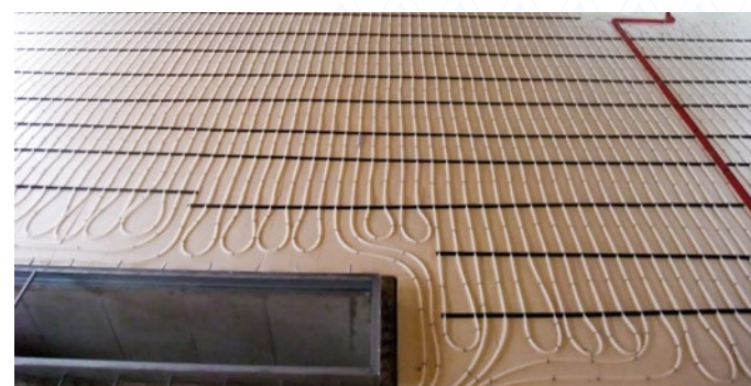
Beispiel: Rohrbefestigung auf der Perimeterdämmung