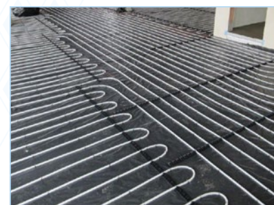
spezifische Heiz-/Kühllast (W/m 2 ) siehe technische Info